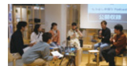
仲間と企画した展示や販売の交流イベントでは、ポッドキャスト部の公開収録も行いました。

A. 私はやる前に考えちゃうタイプだけど、行動する人は目指す方向にどんどん進んでいます。形にならなくても、できることからやってみるのがコツみたい。ここはそんな人がいっぱいだから刺激がもらえます。一人だとなかなか続けられないですね。