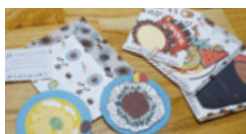
各地のクラフト系イベントでは「雑貨屋mimi」の屋号で手作りのレターセットを販売しています。